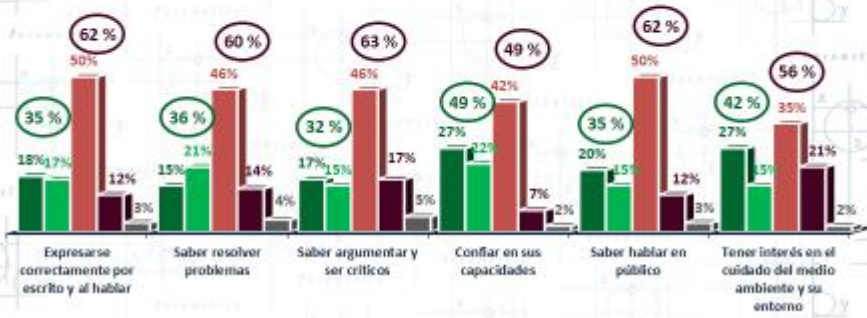
Parametría ENCUESTA NACIONAL EN VIVIENDA / 800 casos / Error (+/-) 3.5 % / Del 22 al 28 de abril de 2017.

Es importante mencionar que a pesar de que los entrevistados fueron formados en un modelo educativo distinto al que hoy se propone, la mayoría (86%), está de acuerdo con que es mejor enseñar a los niños a pensar y defender sus argumentos. Nuevamente este porcentaje aumenta entre la población con hijos en edad escolar donde llega al 90%.